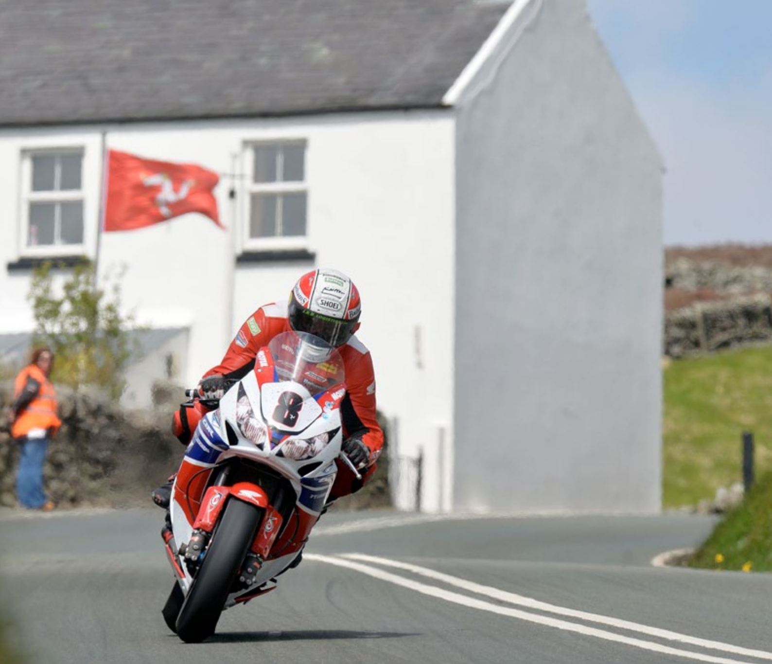
▶ Isle of Man Tourist Trophy / Michael Rutter / Honda TT Legends team / Honda CBR 1000 Fireblade