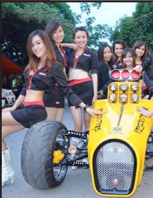
Moto FC Club Anniversary