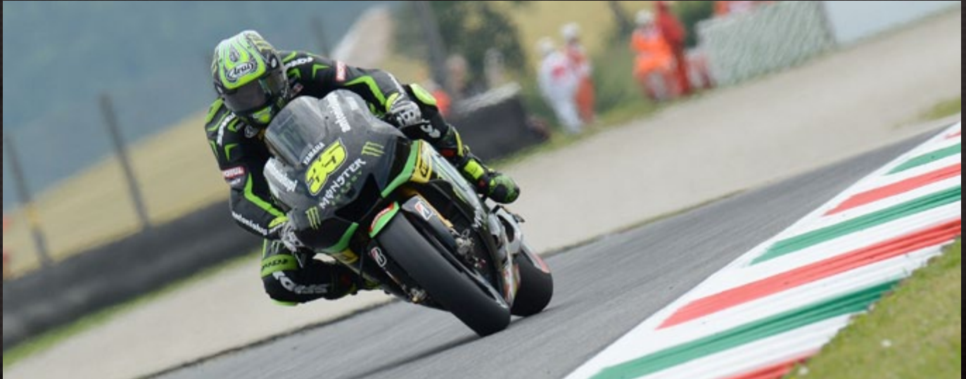
Cal Crutchlow / Monster Yamaha Tech3 Team / Yamaha YZR-M1

Round 01 02 03 04 05 06 07 08 09 10 11 12 13 14 15 16 17 18