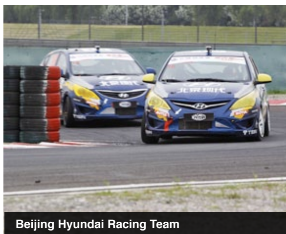
Beijing Hyundai Racing Team